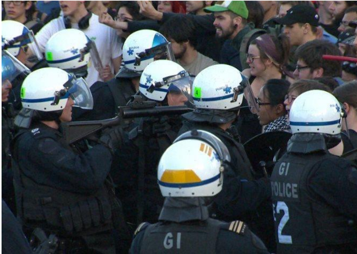
Pendant la grève étudiante